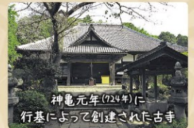
神亀元年(724年)に行基によって創建された古寺