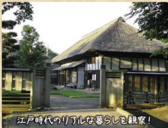
江戸時代のリアルな暮らしを観察!