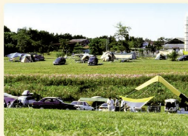
自然の中でのんびり過ごすのに最適