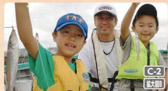
魚種の豊富な東京湾で釣り体験!

☎0438-62-2038 ☑奈良屋13-4(ギフふじい店内) ☒10:00~17:00 ☒水・木曜 ☒https://www.kyousitu.net