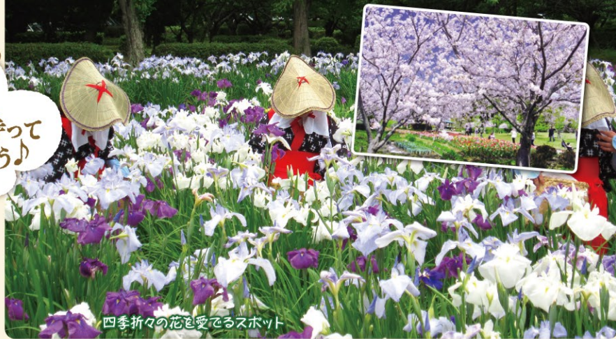
四季折々の花を愛でるスポット