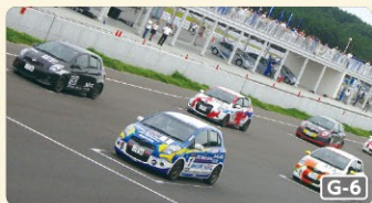
本格的なカーレースが体験できる