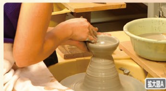
オリジナルの器を作ってみよう!

☎0438-75-2966 ☑林562-1-3 ☒チェックイン10:00~チェックアウト15:00 ☒月曜(祝日の場合は翌日休)・第1・第3火曜 ☒デイキャンプ大人800円・小人600円 (3才~小学生)、宿泊は別途料金 ☒無料(オートキャンプ場への宿泊は別料金) ☒http://www.morimaki-camp.com/