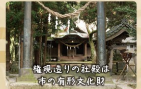
権現造りの社殿は市の有形文化財