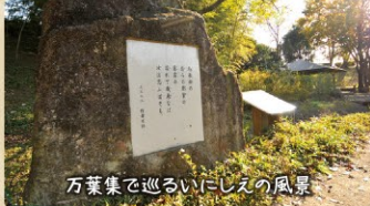
万葉集で巡るいにしへの風景

☎0438-63-0811 ☒下新田1133 ㉑9:00~17:00 ㉒月曜日・祝日の翌日・12月26日~1月4日ほか、館内整理のため年末特別休館あり ㉓無料 ㉔無料