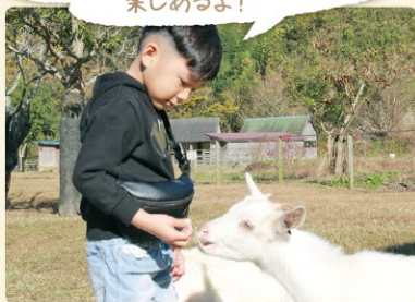
かわいい動物たちと触れあえる

ダチョウやアルパカ、ウサギ、カピバラなど癒し系アニマルが勢ぞろい。縁内ほとんどの動物が、限りなく自然に近い環境で触れ合うことができます。動物たちとの触れ合いを通じて、人と動物との“縁”を感じてください。