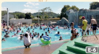
滝のあるプールが名物

☎0438-60-5270 ☑林348-1 ☒9:00~17:00 ☒無休 ☒イベントにより異なる ☒有料 ☒http://www.sodegaura-forest-raceway.com