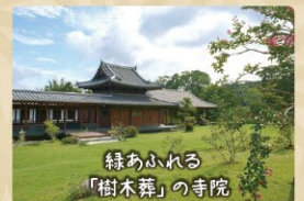
緑あふれる「樹木葬」の寺院