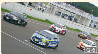
본격적인 카 레이싱을 체험할 수 있습니다