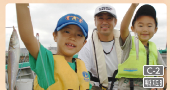
어종이 풍부한 도쿄만에서 낚시 체험!

☎0438-62-2038 ☑나라와 13-4(기프트 후지이점 앞) 10:00~17:00 ☑수 · 목 ☑https://www.kyousitu.net