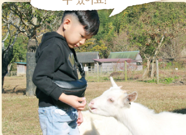
귀여운 동물을 만날 수 있다

소데가우라 후레아이 동물원에서는 동물과의 만남 외에 수확 체험도 즐길 수 있어요!