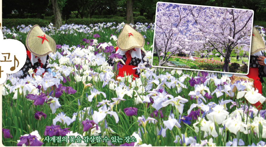
세계절의 꽃을 감상할 수 있는 장소