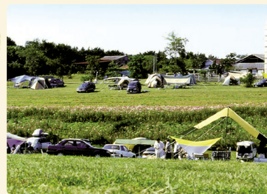
자연 속에서 느긋하게 지내기에 최적인 장소

녹음이 넘치는 광대한 부지 안에 설치된 반려견 놀이터에서 반려견과 놀거나, 작은 동물들과 직접 만날 수 있습니다. 취사장, 수세식 화장실, 샤워, 세탁기도 완비되어 있습니다. 바비큐 도구도 대여해 드립니다.