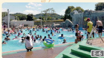
폭포가 있는 명물 수영장

☎0438-60-5270 ☑하야시 348-1 9:00~17:00 ☑무휴 ☑이벤트에 따라 다름 ☑유료 ☑http://www.sodegaura-forest-raceway.com