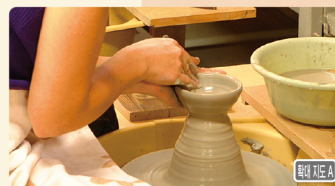
자신만의 그릇을 만들어 보세요!